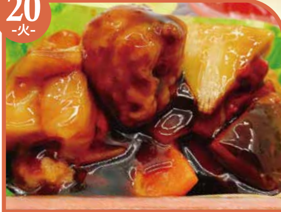
肉団子の甘酢あん