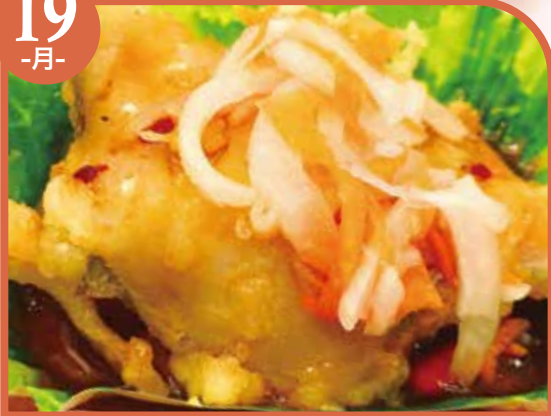
白身魚の南蛮漬け