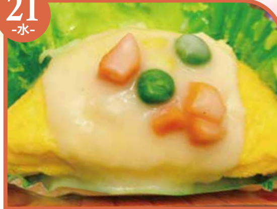
オムレツ ホワイトソースかけ