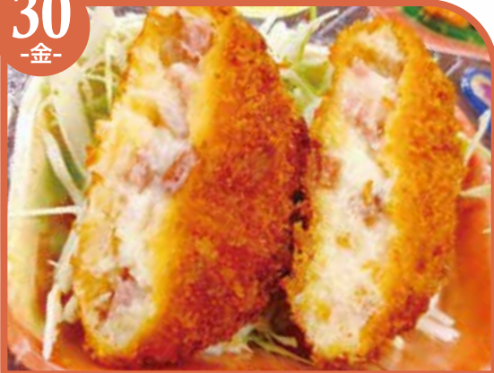
ベーコンマヨカツ