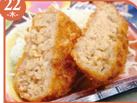
チーズメンチカツ