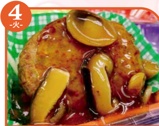
4 -火- ハンバーグ きのこあん エネルギー338kcal / タンパク質12.7g / 脂質14.8g