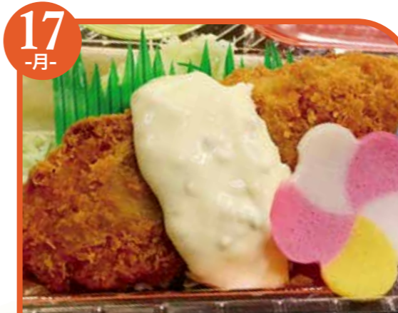
17 -月- 白身フライ エネルギー341kcal / タンパク質14.9g / 脂質19.6g