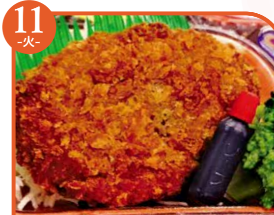
11 -火- 牛肉コロッケ エネルギー424kcal / タンパク質9.8g / 脂質22.9g