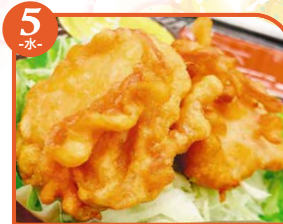
5 -水- 鶏天 エネルギー422kcal / タンパク質14.1g / 脂質27.6g