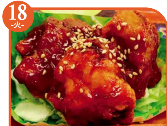
18 -火- コチュジャン唐揚げ エネルギー466kcal / タンパク質13.9g / 脂質27.1g