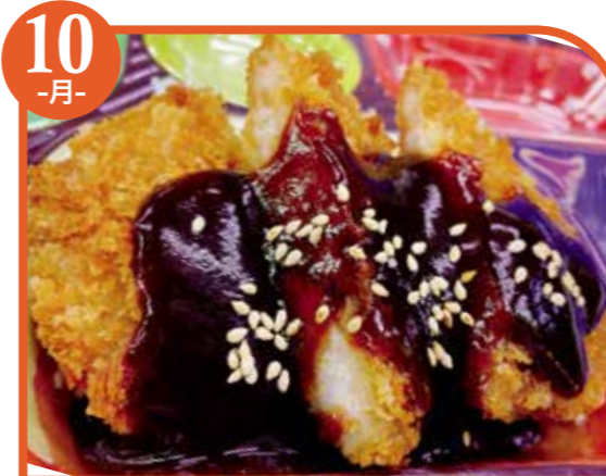
10 -月- 味噌カツ エネルギー387kcal / タンパク質12.7g / 脂質20.9g