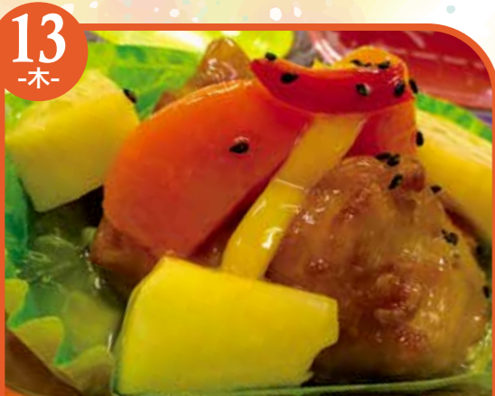
13 -木- 鶏と野菜の甘酢あん エネルギー439kcal / タンパク質10.5g / 脂質19.4g