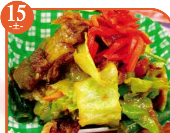
15 -土- 豚肉と野菜の生姜炒め エネルギー367kcal / タンパク質15.8g / 脂質23g