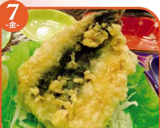
7 -金- いわし天ぷら エネルギー283kcal / タンパク質13.7g / 脂質11.7g