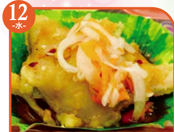
12 -水- 鱈の南蛮漬け エネルギー260kcal / タンパク質15.4g / 脂質9.5g