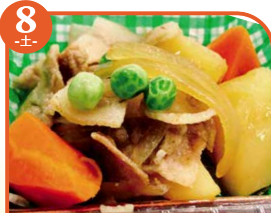
8 -土- 肉じゃが エネルギー320kcal / タンパク質12.3g / 脂質12.7g