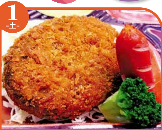
1 -土- カレールーフライ エネルギー437kcal / タンパク質9.2g / 脂質27.2g

栄養成分表記はおかずのみの成分値です。 ご飯は、100gあたり168kcalです。