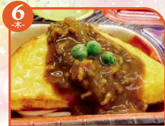
6 -木- オムレツ カレーソース エネルギー355kcal / タンパク質15.2g / 脂質18.3g