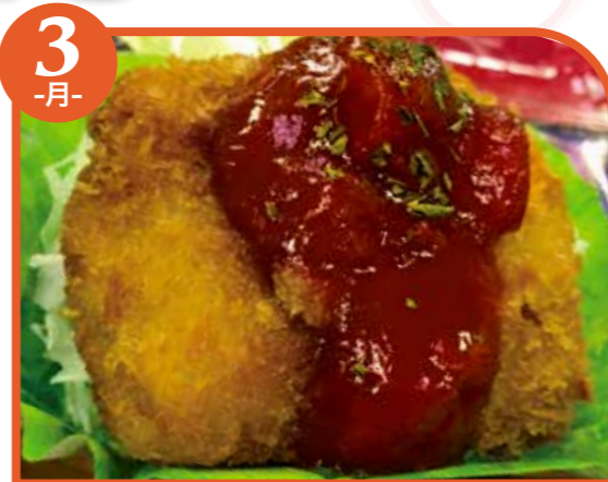
3 -水- フィッシュフライ トマトソース エネルギー432kcal / タンパク質11.6g / 脂質24.6g