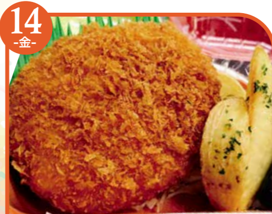
14 -金- カレーコロッケ 炊き込みご飯 エネルギー406kcal / タンパク質8.1g / 脂質23.3g